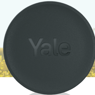
קורא קירבה Yale Dot