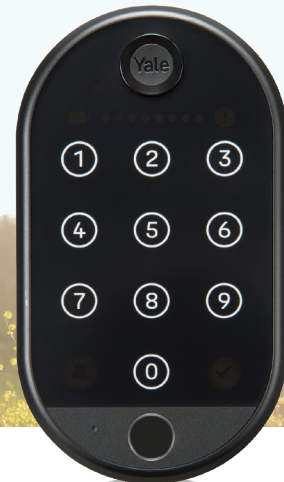
קודן טביעת אצבע